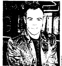
Hoy vuelve 'La casa de tu vida' en TS.