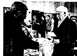
Están más cogenciados políticamente.

Los mayores de 65 años sólo representan el 5% de los cargos públicos en las principales instituciones valencianas. En Les Corts, hace ahora cuatro años, la media de edad de los electos era de sólo 42. En cambio votan mucho más que los jóvenes: un 30% de los que acuden a las urnas.