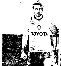
Baraja, el último misterio.